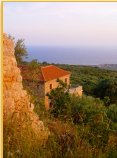
Nord-Westseite des Sonnenhauses. Blick zum Fischer Dorf Agios Nikolaos im Abendlicht.

Fahrtdauer ungefähr 4 Stunden von Athen, 1 Stunde von Kalamata