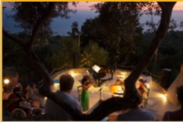
Sonnenuntergangskonzert im Amphitheater