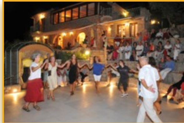
Tanz Fest Sonnenlink "Glendi"

Da es als Hochsommer-Ferienseminar ausgeschrieben ist, wurde viel Zeit für Ausflüge zum Schwimmen und sonstigen Urlaubs-aktivitäten eingeplant.