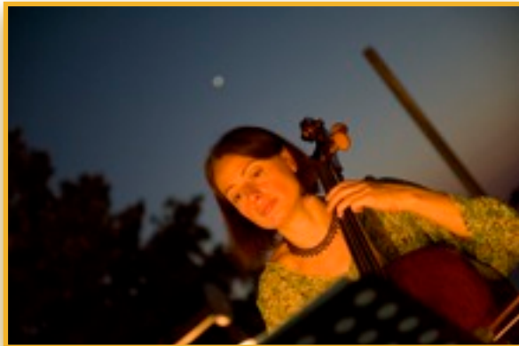
Musik im Mondenschein